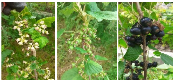
Slika 4. Cvetanje, zametnuti i zreli plodovi crvene ribizle – 2023. godina (Original)