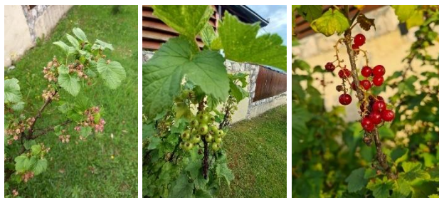
Slika 5. Cvetanje, zametnuti i zreli plodovi crvene ribizle – 2023. godina (Original)