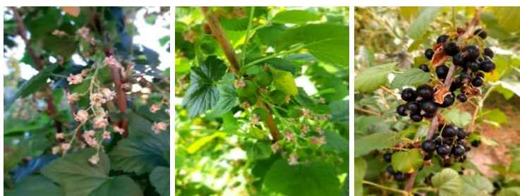
Slika 2. Cvetanje, zametnuti i zreli plodovi crne ribizle – 2022. godina (Original)

Proučavajući period između ove dve fenološke faze, Čolić i sar. (2007) svojim dvogodišnjim istraživanjem za pet sorti crvene ribizle, konstatuje dosta manji broj dana, koji iznosi 16 dana od cvetanja do potpunog sazrevanja plodova, na području Pančeva. Prema Đorđević i sar. (2022) dvogodišnjim istraživanjem crne ribizle, utvrđeno je da je 2019. godine bio kraći broj dana između navedene dve fenofaze, u odnosu na 2018. godinu, i ta razlika je iznosila od 2 do 6 dana. Istraživanja su sprovedena na lokalitetu u blizini Beograda.