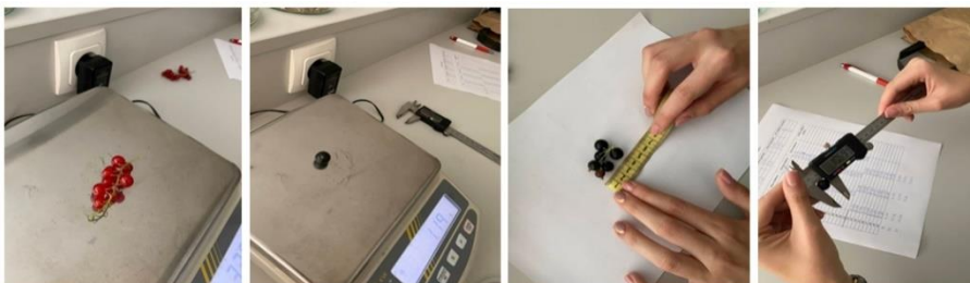
Slika 1. Merenje mase i dimenzija grozda i bobica crne i crvene ribizle (Original)

Dobijeni rezultati su obrađeni metodom analize varijanse za monofaktorijalni ogled, a značajnost razlika između srednjih vrednosti je utvrđena pomoću Dankanovog testa višestrukih intervala za verovatnoću 0,05.